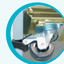
RUEDAS CON FRENO OPCIONAL