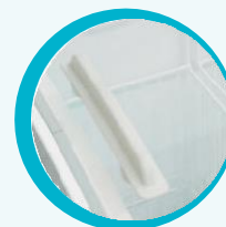
PUERTA CON JALADERA EN EL CRISTAL