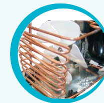
CONDENSADOR AUXILIAR DE BAJO MANTENIMIENTO