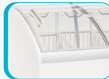
PUERTAS DE VIDRIO DESLIZABLES