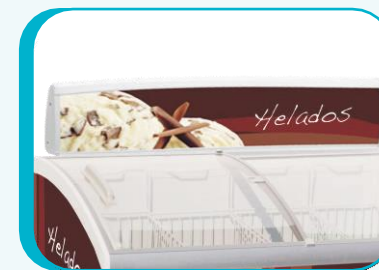
COPETE PROMOCIONAL OPCIONAL